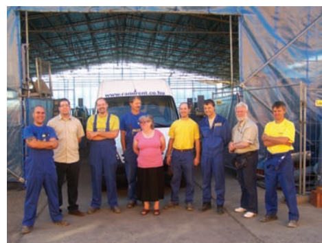
Tisztelettel az Építési felvonók üzletág csapata

Ha anyagmozgatásról van szó, gondoljanak ránk, üzletágunk a legmegfelelőbb és legkedvezőbb megoldást fogja megtalálni Önöknek!